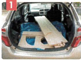
コンパクトカーで十分運べます

持ち運びやすさと組み立てやすさを考え、蝶番を用いてパタパタと折りたためる構造にしました。女性でも10分程度の組立時間で工具を使用せずに簡単にご利用いただけます。