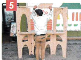
暖簾かけを設置します。