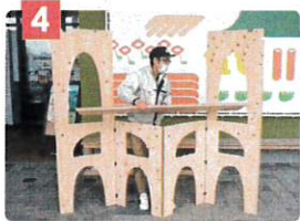
大天板を設置し、大天板の形に合わせて構造体を地絡めます。