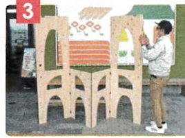
片方ずつ側板を開き、支柱をネジで固定します。