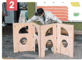
まず蛇腹の板を大きく開きます。