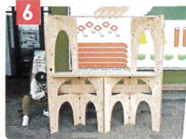
小天板を設置します。