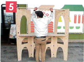
5 暖簾かけを設置します。