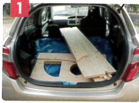
1 コンパクトカーで十分運べます

持ち運びやすさと組み立てやすさを考え、蝶番を用いてパタパタと折りたためる構造にしました。女性でも10分程度の組立時間で工具を使用せずに簡単にご利用いただけます。