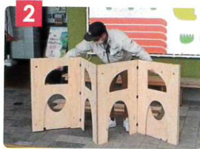
2 まず蛇腹の板を大きく開きます。