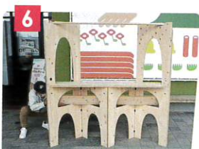
6 小天板を設置します。