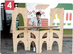
4 大天板を設置し、大天板の形に合わせ構造体を地締めします。