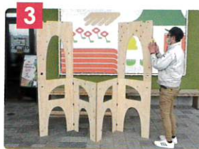
3 片方ずつ側板を開き、支柱をネジで固定します。